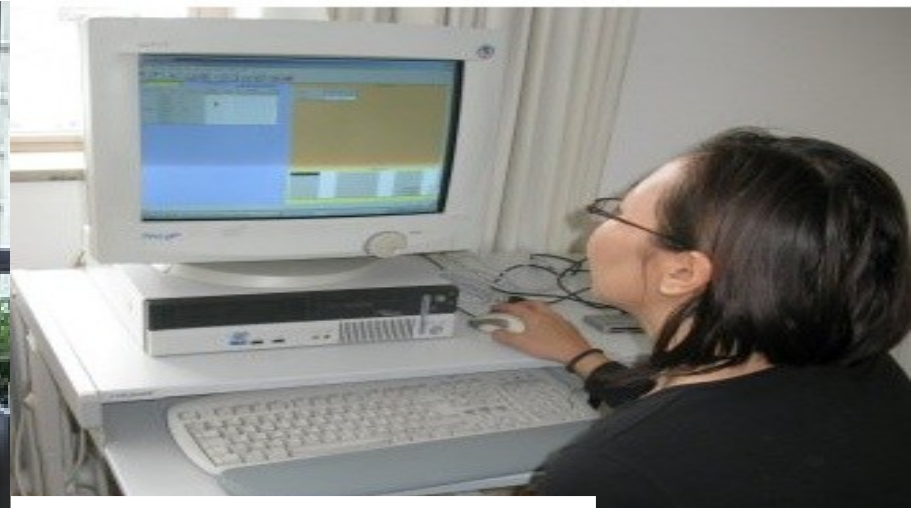
Кливаду системтэй холбосон гол Компьютер Институтэд өрөөнөөсөө